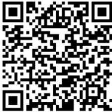
Código QR para validación en sede

Regulación CSV: Decreto 3628/2017 de 20-12-2017